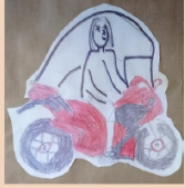
MOTO TAPA PLUJA