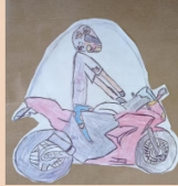
CÚPULA TAPA PLUJA