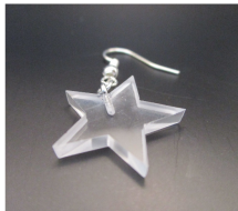
● ● ● ○ Arracada estrella